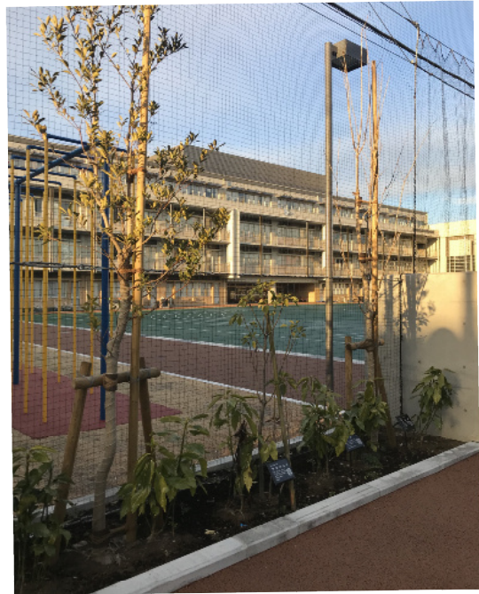
↑ 校舎南側 校庭