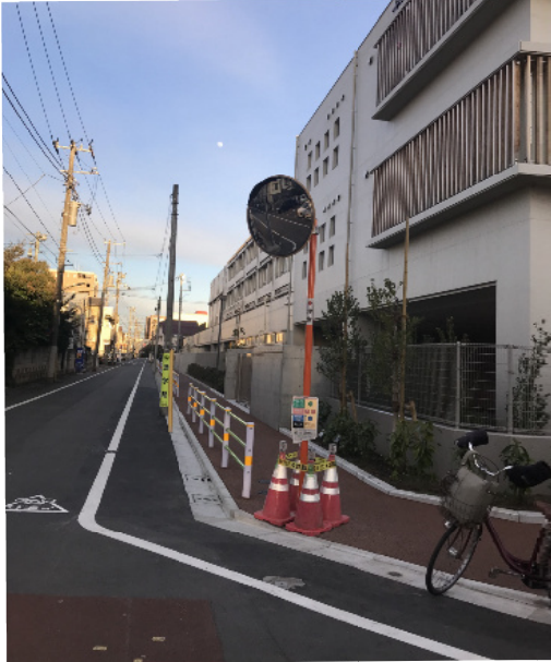
→ 校舎北側 学童、放課後ひろば、多目的室