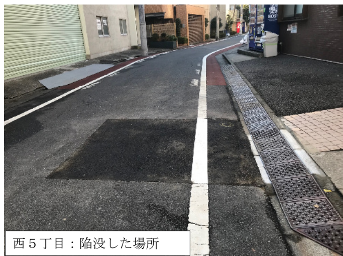
西5丁目：陥没した場所