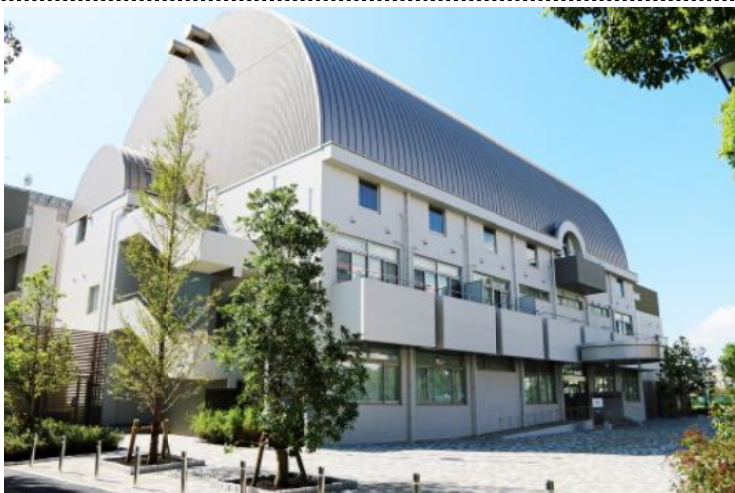
区のホームページより：平和の森公園内にある「ゆいっつ」