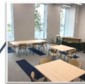
<共用会議室 兼 運営会社事務室>