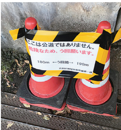
改修されずにポールが

2日後、東京都第二建設事務所の課長から、「大田区の方で対応してもらおうことになりましたから」との連絡を受けましたが、まだポールを立てるだけで抜本的な改修になっていません。皆さんのご意見をお聞かせください。