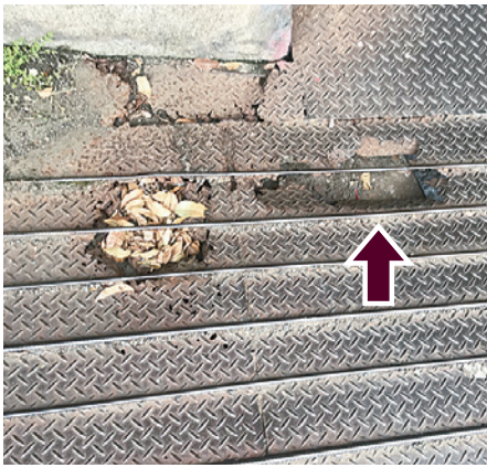
ぽっかり穴が開いている

都なので」「この場所は不法物件なんです」なども。東京都の第二建設事務所担当課長に連絡をしたら「日常の維持管理は大田区です」「事務処理の特例条例」などの話が出されました。しかし、私は「お互いに領土争いみたいなことを言っても利用している人の危険を、まず解決すべきではないか」と説得し、話し合ってもらうことになりました。