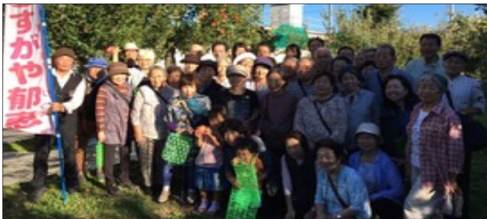
10月7日、後援会で沼田へバスハイク。リングゴ狩りに行きました。

10月7日後援会で、バス旅行に行きました。私は、リングゴ狩りは初めての経験なのでとても楽しみでした。また、地域の方々と共に過ごせる時間が持てたことは大変貴重でした。これからは楽しい企画含めて実現していきたいと思います