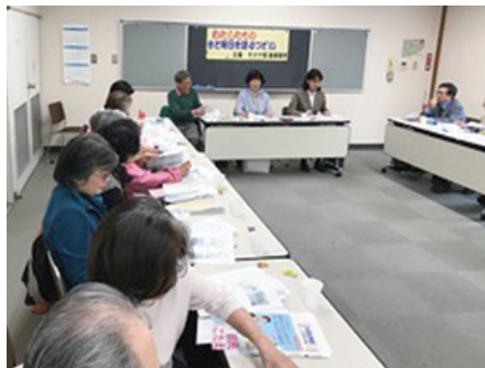
大森西地域のつどい