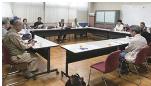
大森東地域のつどい

区政では「新空港線蒲蒲線は、区民に便利にならないし、結局、東急電鉄のためだけではないか」「区議会議員の海外視察は中止させたい」など意見が活発に出されています。 「チラシを見て初めてきました」という方も。今後も、ぜひみなさん参加してください。