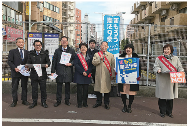
I LOVE 憲法9条署名 (大田区議団)

2018年の幕が開け、あっという間に2月です。訪問活動の中で、印刷屋さんから「やっと9月期の決算が終わって、消費税を納めたよ。消費税がなければどれだけ助かるか、10%になったらやっつけいけない」「大田区からの仕事が出来なくなった、もっと私たちに仕事をまわしてほしい」。戦争体験した女性は「学校に行きたかったけれども行けなかった。戦争はこりこり、憲法9条変えたら絶