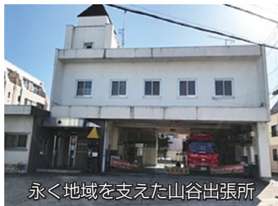
永く地域を支えた山谷出張所