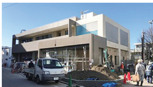
新しい山谷出張所

大森西5丁目都営住宅跡地に建設中だった大森消防署山谷出張所の新庁舎工事が着々と進み、2月26日には落成式、3月中旬に新庁舎での仕事が始まります。「山谷消防署」として、地域になじみの深い、そして地域の安全のために心強い消防署です。これからもよろしくお願ひします。 また、旧消防署跡地の活用については、地域の方々に「考える会」が立ち上がり、大田区に「保育園をつくってほしい」「高齢者が集まれるような場所をつくってほしい」「音響設備が付いた集会室がい」など要