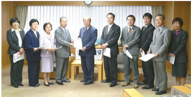
学校給食食材の放射能検査を求めて緊急要求する党区議団 (11月24日)

党区議団の要求によりさつそく区が再測定し、高い値が確認されたため、2月2日に除染作業が行われました。