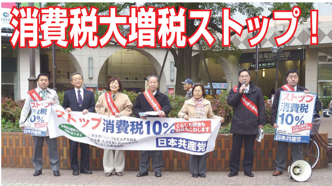
党区議団の消費税増税反対の宣伝・署名行動 (JR蒲田駅西口・2月8日)

と、雇用や中小企業を大企業の横暴から守る「ルールある経済社会」に踏み出すことです。日本共産党区議団は、消費税増税と社会保障の改悪を許さない世論と運動を広げるために、全力で奮闘します。