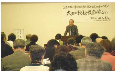
大田消費者生活センター (1月22日)

今春から中学校の歴史・公民の教科書に、侵略戦争を正しい戦争と描き、原発を推進する立場の育鵬社版が使われます。