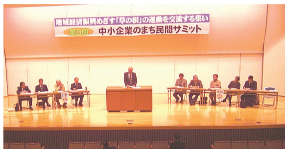
全体会 (4日・区民センター)

また、大田区教育委員会は文部科学省が発行した「放射線副読本」を小中学校で使うとしています。この「副読本」は「放射線は安全」という立場からの記述が基調「身を守ると